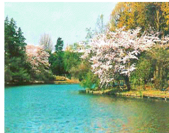
Parc d' Omiya