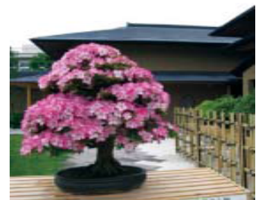
Musée de Bonsai

Course: Sta.JR Ômiya ⇒ Rue Ichinomiya ⇒ Nino torii ⇒ Hikawa Jinja ⇒ Hikawa sando ⇒ Sanno torii ⇒ Shin-kyo Ro-mon Buden Haiden at Hikawa Jinja ⇒ Parc d' Omiya ⇒ Jardin Japonais ⇒ Gokoku Jinja ⇒ Senyu pond ⇒ Stade d' Archerie ⇒ Village de Bonsai ⇒ Musée de Bonsai ⇒ StaJR. Toro ( itinéraire de 3.5km, 3 hours ≈ au total )